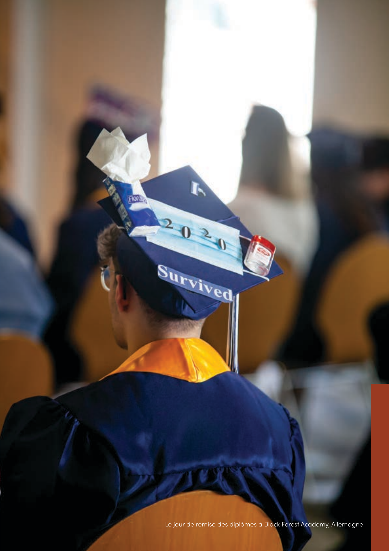
Le jour de remise des diplômes à Black Forest Academy, Allemagne