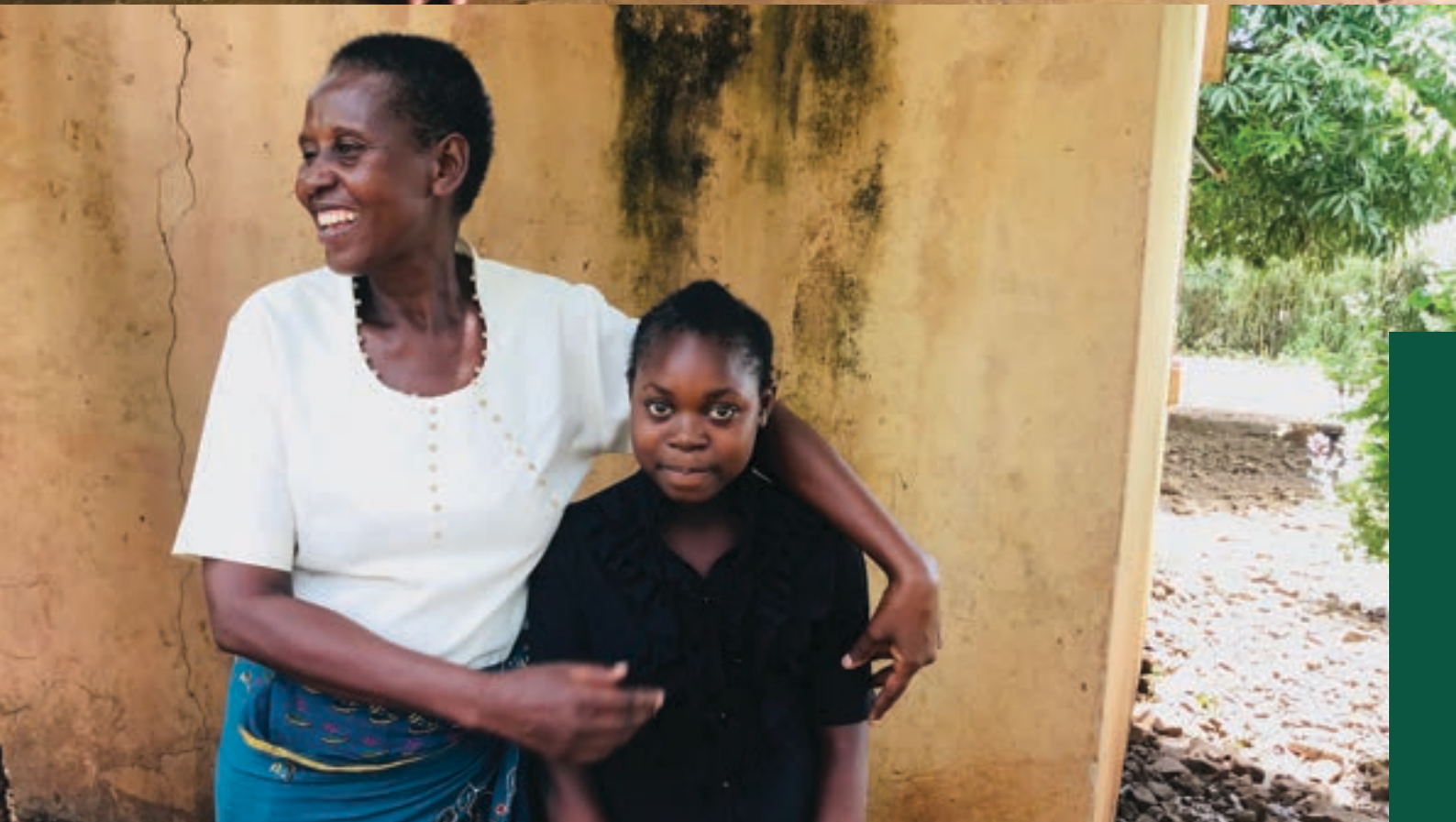
En haut: Les élèves de l'école en Zambie En bas: Une tutrice d' Open Schools avec une étudiante à Lusaka, Zambie