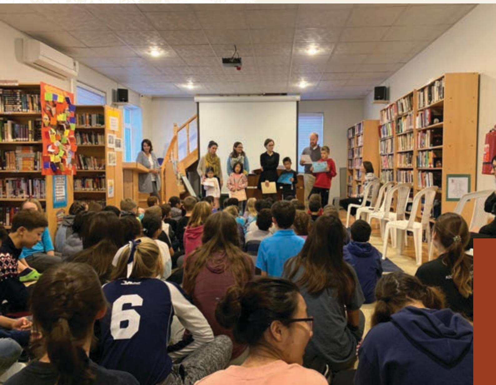
Une photo d'une assemblée d'une école dans un endroit d'accès créatif